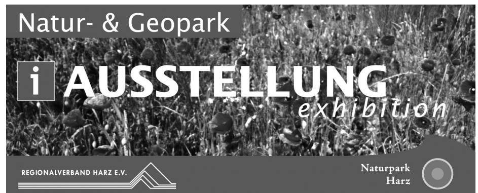
Abb. 3: Ausstellungsschild des Natur- und Geopark Harz.

Aufgrund ihrer vergleichbaren Aufgaben und den vorhandenen räumlichen Überschneidungen können Geoparke und Naturparke