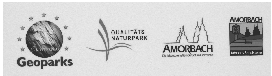
Abb. 2: Gemeinsame Beschilderung des Qualitätsnaturparks und Geoparks Bergstraße-Odenwald.

Über ein europäisches Förderprogramm versucht der Geo-Naturpark zurzeit die Pflege und Vermarktung traditioneller Kultur-